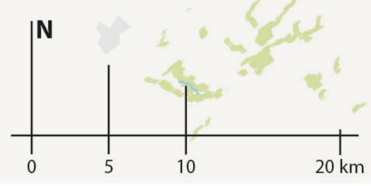
Les espaces naturels, trame verte et bleue | De natuurlijke ruimten, groene en blauwe traject | Natural areas, green and blue framework