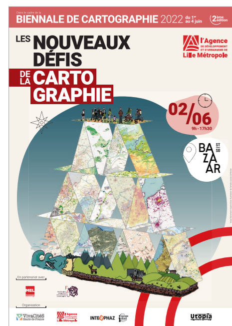
Affiche de la journée thématique portée par l'ADULM - Biennale de cartographie 2022 © ADULM - 2022