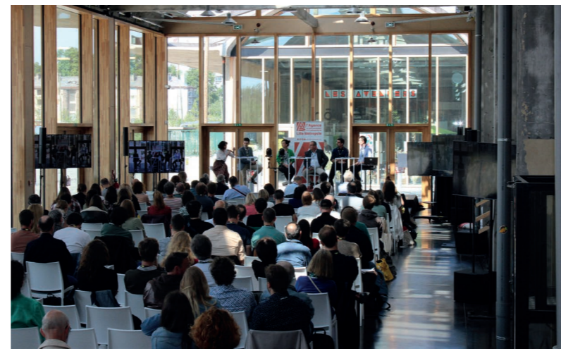
Journée thématique « les nouveaux défis de la cartographie »

La journée proposée par l'Agence avait pour ambition de répondre aux interrogations suivantes : la cartographie peut-elle se réinventer et dépasser les limites de sa grammaire pour représenter le monde anthropocène et les transitions en cours ? Comment se distille-t-elle dans la société, et peut-elle évoluer pour appréhender les défis environnementaux ? Comment se met-elle au service des territoires pour aider à l'analyse, à la décision et à la mise en visibilité des transitions auxquelles nous devons faire face ?