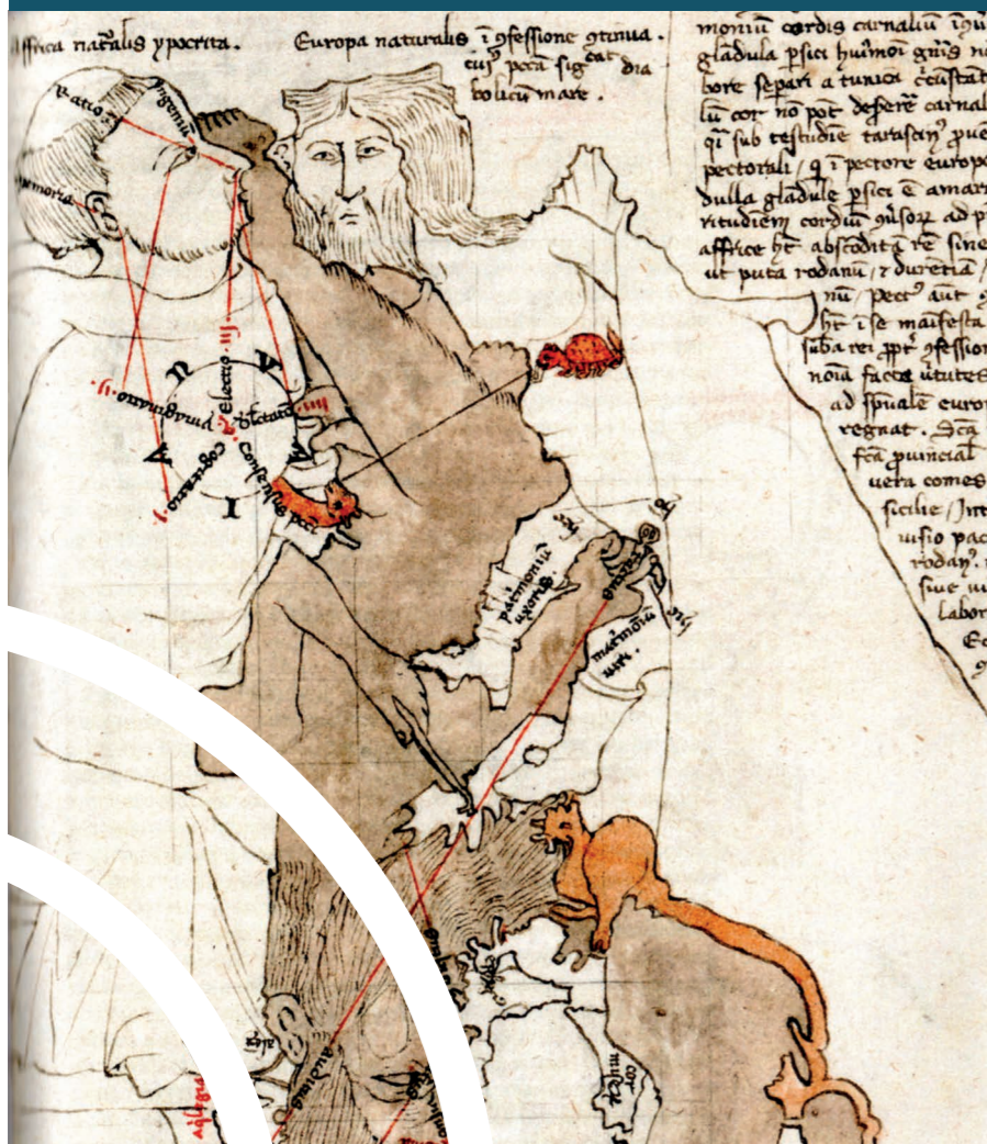
Vision anthropomorphe de la Méditerranée à trois, par Opicius de Canistris (1296-1350)

Il ne suffit pas de revendiquer une vaine « liberté cartographique » : prendre en compte l'anthropocène, ménager la place à d'autres rapports au vivant implique de se défaire de prétendues évidences cartographiques, de considérer et d'inventer d'autres pratiques. Rien de plus sérieux que les jeux ou les approches artistiques de la carte.